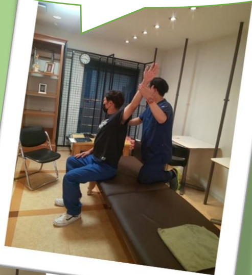
肩が痛い方のストレッチ